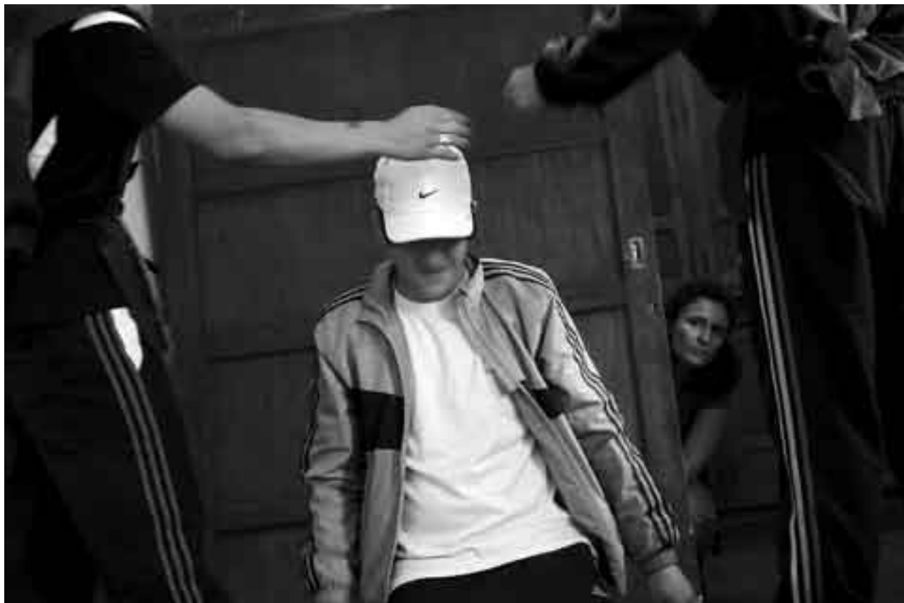
Obra de teatro con jóvenes internados en el centro Ituzaingó de la Colonia Berro.