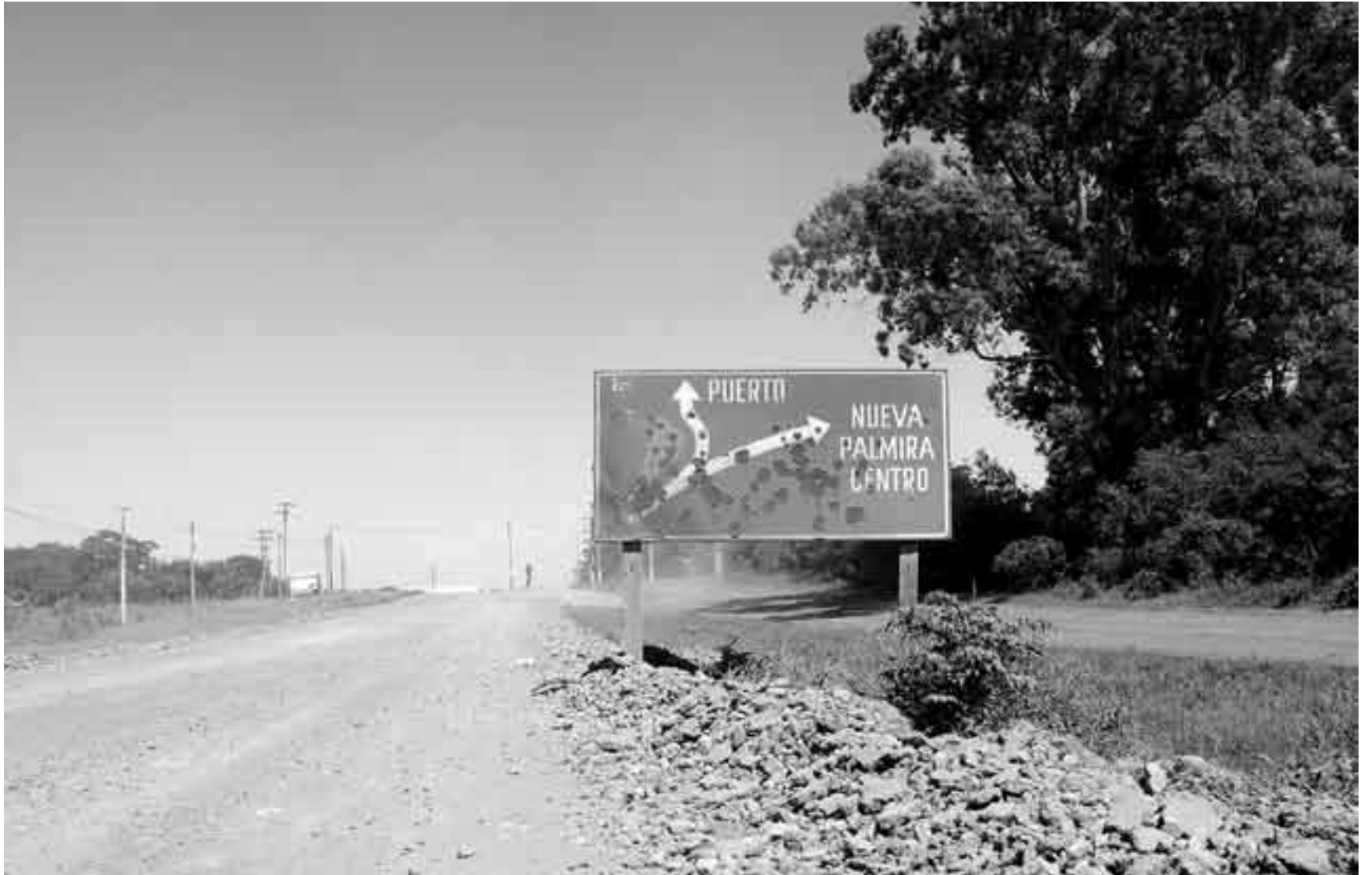
Ruta de entrada a la ciudad de Nueva Palmira.