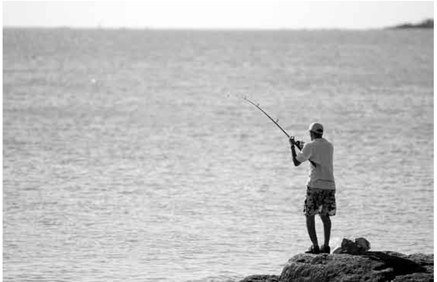
Pescador en Colonia del Sacramento.

Los problemas económicos que sufren los productores agrícolas distan bastante de la realidad de la compañía Mon-