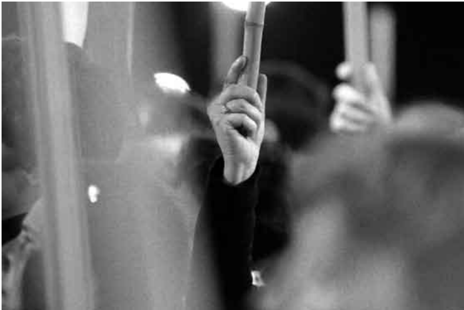
14ª Marcha del silencio el 20 de mayo de 2009.