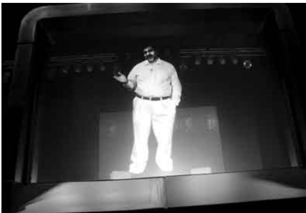
Videoconferencia holográfica por parte de Vivek Wadhwa, en el Foro de Innovación de las Américas en el Latu.

F -Sí, y cada vez más. Están los clientes que necesitan estar siempre a la vanguardia y se despegan de los otros por