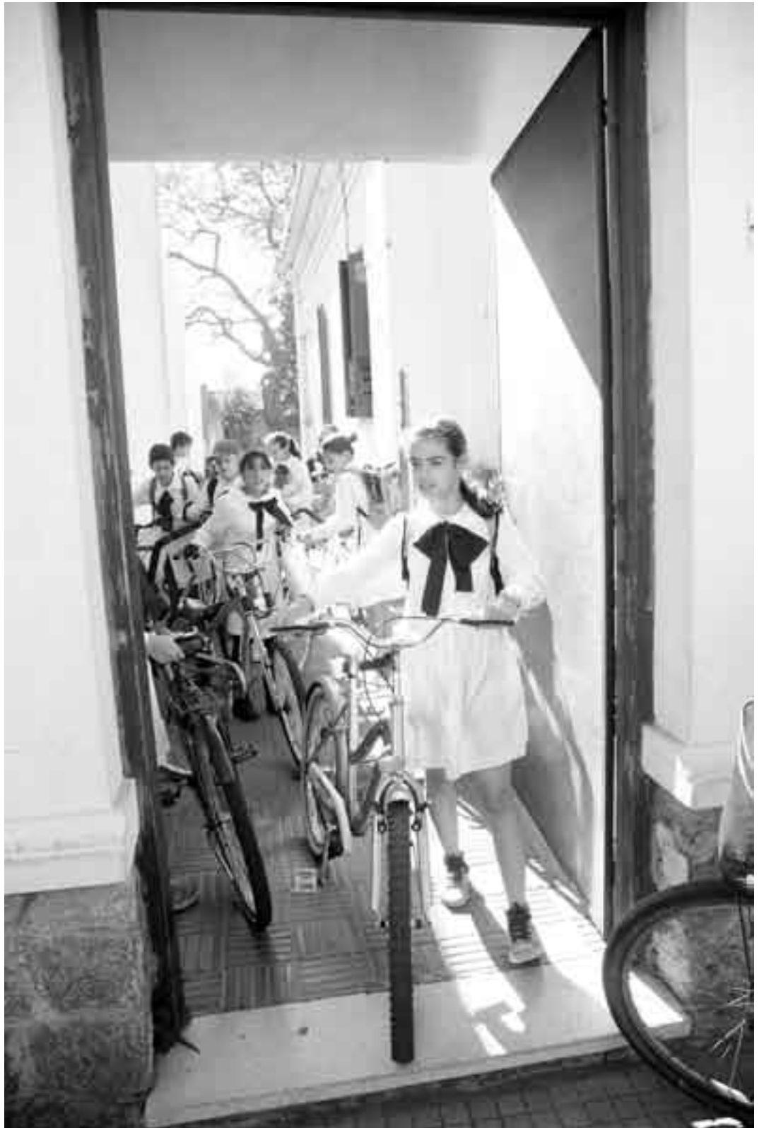
Los escolares cuando salían de la sede del Centro Cultural La Caja para dirigirse a los estudios de la FM Radiolugares, en Carmelo.

La propuesta de los niños de La Caja sobre el futuro se dividió en tres dimensiones: música, sociedad y tecnología. Agustina, quien toca el piano y se encanta con el xilofón, piensa: “Todo va a estar dominado por tecnología. Los microondas van a tener patitas y traernos la comida; pero queremos hacer cosas por noso-