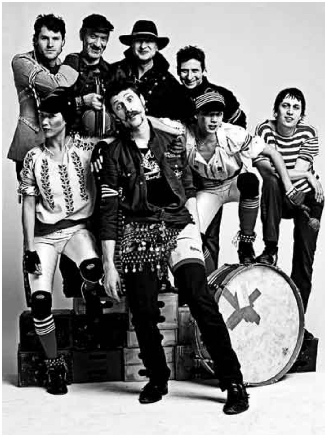
GOGOL BORDELLO.

Nikolái Vasilievich Gógol (1809-1852), escritor ucraniano nacido dentro del imperio ruso y a quien se adjudica la primera novela rusa moderna, o mejor, lo que se pudo rescatar de Almas muertas (después de que la quemara), es el responsable del nombre de estos inmigrantes locos. Formados en el Lower East Side de Nueva York en 1999 por el ucraniano Eugene Hutz, los Gogol Bordello son la banda gypsy punk amiga de Madonna –con la que compartieron escenario en el Live Earth. Un combo multicultural, cabaretero y circense que fusiona la música gitana proveniente de Europa del este con el punk –pero el punk de Joe Strummer, que desde The Clash y después con Los Mezcaleros siempre estuvo atento al reggae y al dub, ese punk que se sintetiza en la actitud, más que en lo rudimentario de la música. Los Gogol basan su sonido en la combinación de violín, acordeón, distorsión, varias voces y una energía desbordante, no obstante su líder, Eugene Hutz, se defiende con lo que nosotros conocemos por guitarra criolla. Con varios discos y EP editados desde 1999 a la fecha, su última y flamante producción titulada Transcontinental Hustle , cuenta con la