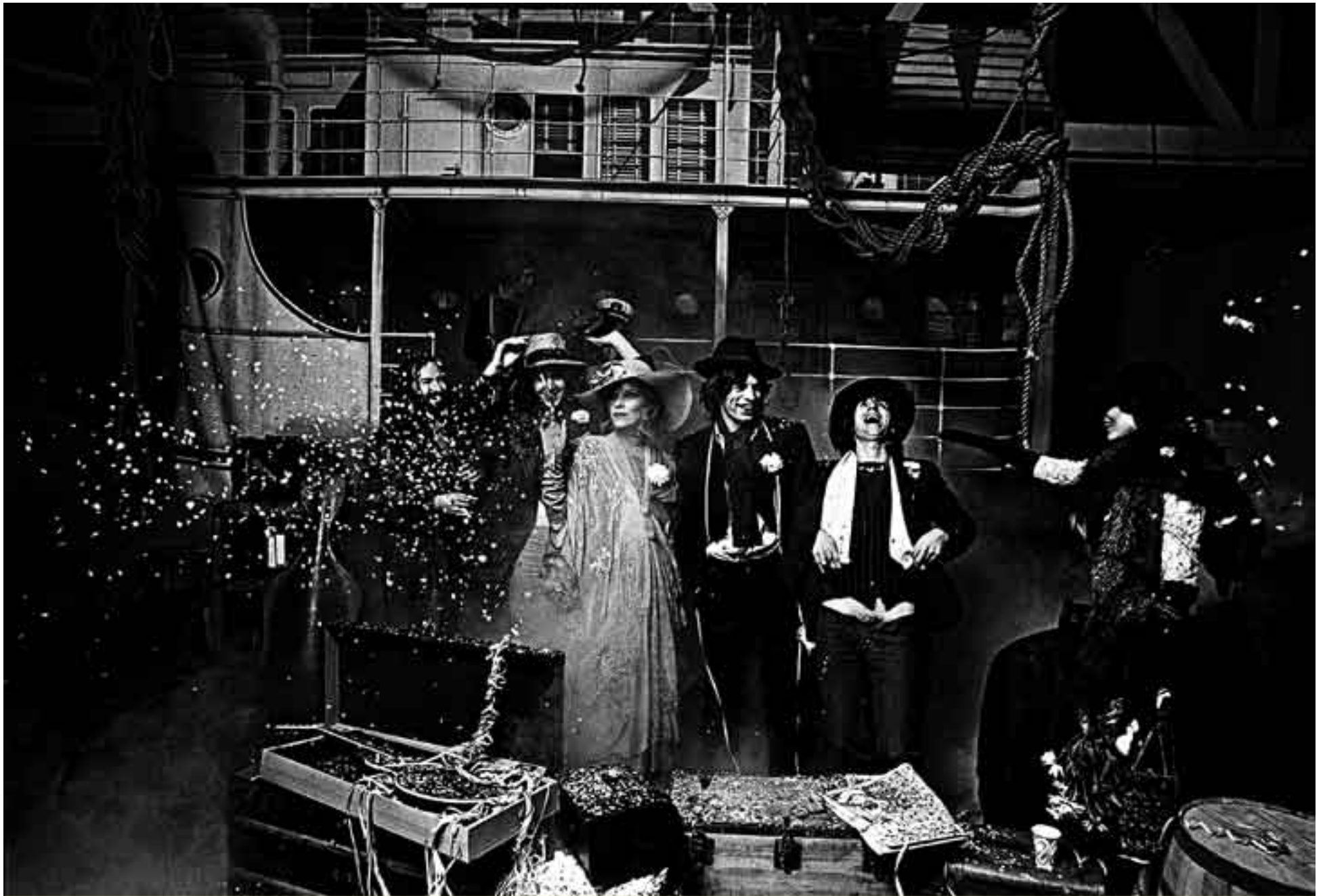
PAG4: FOTO PROMOCIONAL DE EXILE ON MAIN STREET (1972)