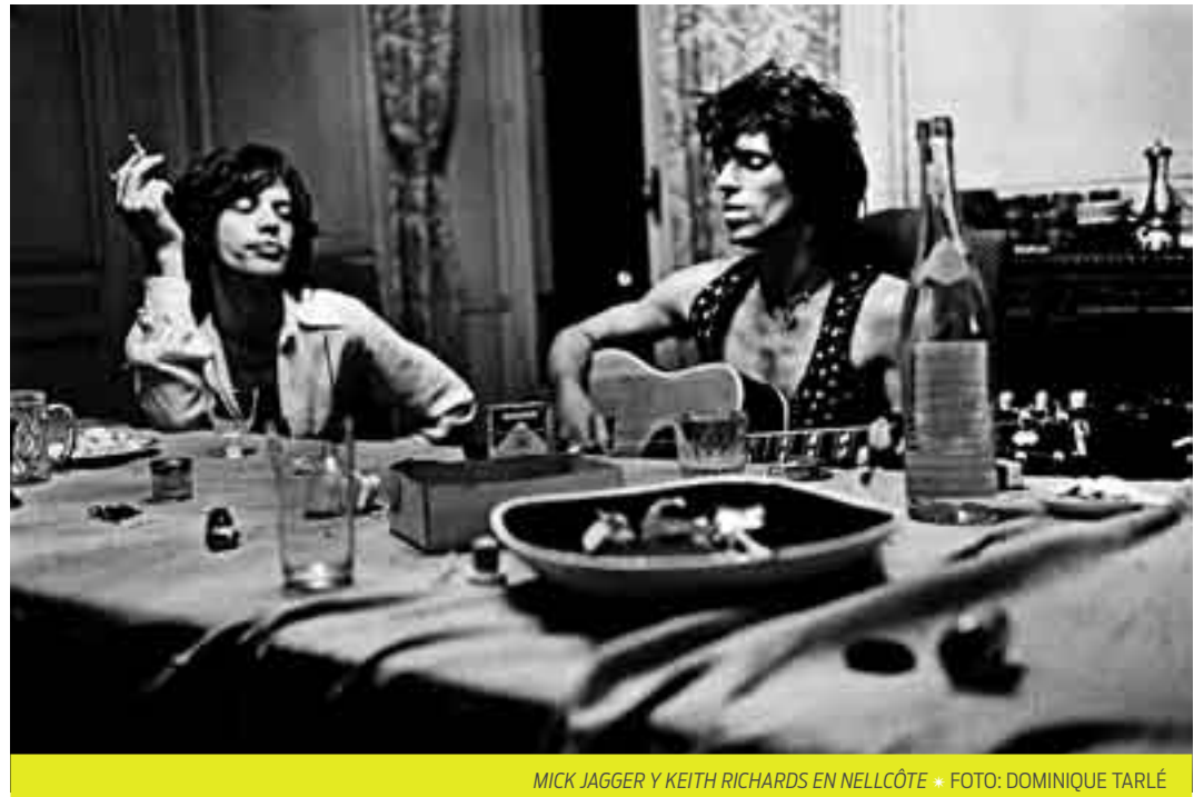
MICK JAGGER Y KEITH RICHARDS EN NELLCÔTE

Podría pensarse que Exile , un disco doble de 18 canciones en una gran variedad de estilos, no es la excepción. De hecho fue criticado en su momento por su falta de cohesión. Sin embargo, el álbum ha trascendido el tiempo como el más orgánico de los Stones, un disco que más que a sus temas –a excepción de «Tumbling Dice» y de «Happy» no hay casi canciones que se hayan convertido en clásicos de la banda, ni que el grupo haya transitado mucho en vivo– ha quedado asociado a un tipo de sonido que es el que, a la larga, ha dado el sello de personalidad a los Rolling Stones.