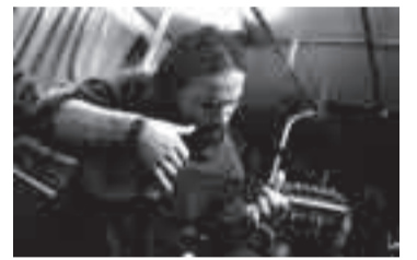
Musico chileno que sube a los ómnibus en Montevideo. (7 de junio de 2006)