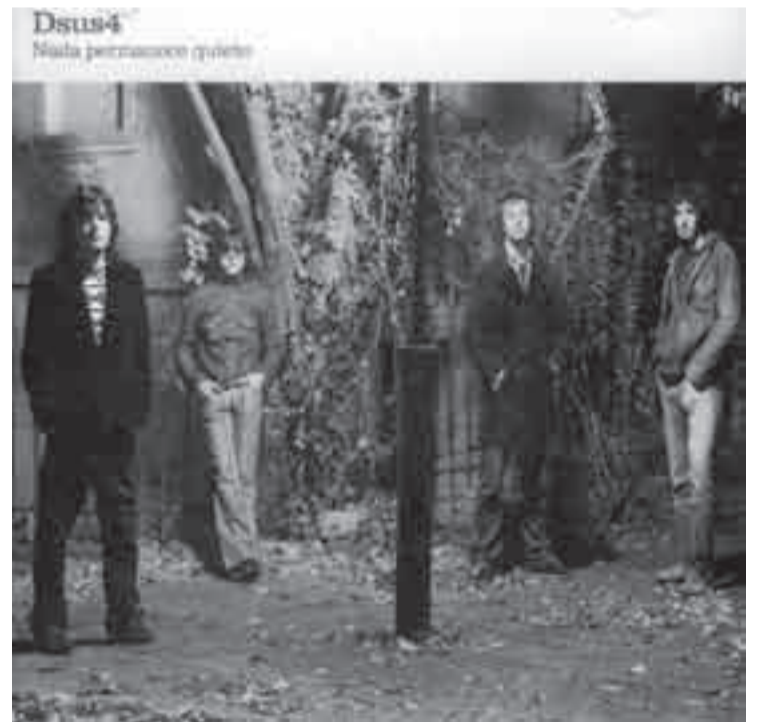
> Nada permanece quieto , de Dsus4, Koala Records, 2006.

Contiene once canciones bastante desestresadas, de melodías cantables con notas largas y espacios generosos entre frase y frase. El hecho de tener más de un cantante les permite hacer coros y contracantos. Esto, junto al uso medido pero efectivo de la guitarra acústica de cuerdas de acero, le da cierto aire poco usual en los discos de rock uruguayo. La guitarra melódica, por otra parte, no juega carreras inútiles sino que toca frases más pensadas para embellecer la canción que para lucir al guitarrista. Además hay dos temas con ciertos aires