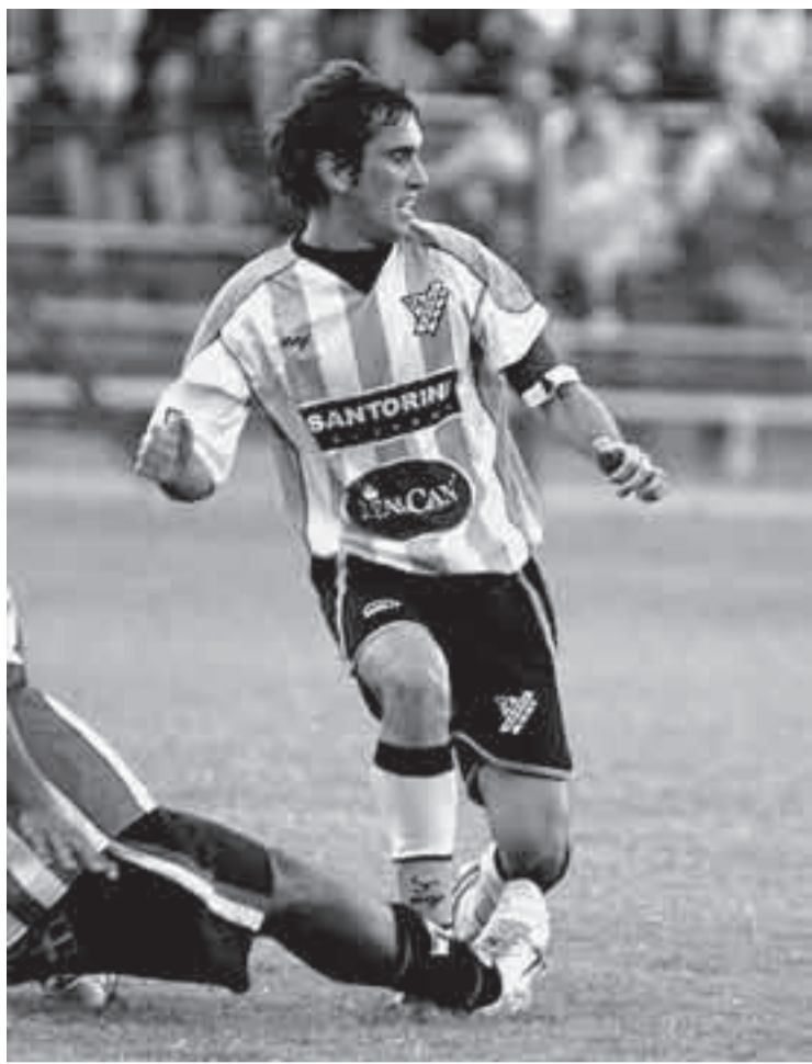
Diego Godín.