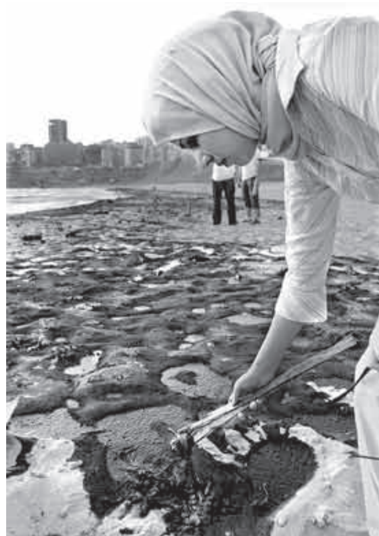
Una mujer recogiendo peces muertos en la popular playa de Ramlet el-Baida (playa blanca) en Beirut, tras la contaminación marítima ocasionada por los bombardeos israelíes en Líbano.

Por el momento, el ejército israelí afirma que ha traspasado el control de la mitad del territorio que ocupó durante la guerra.