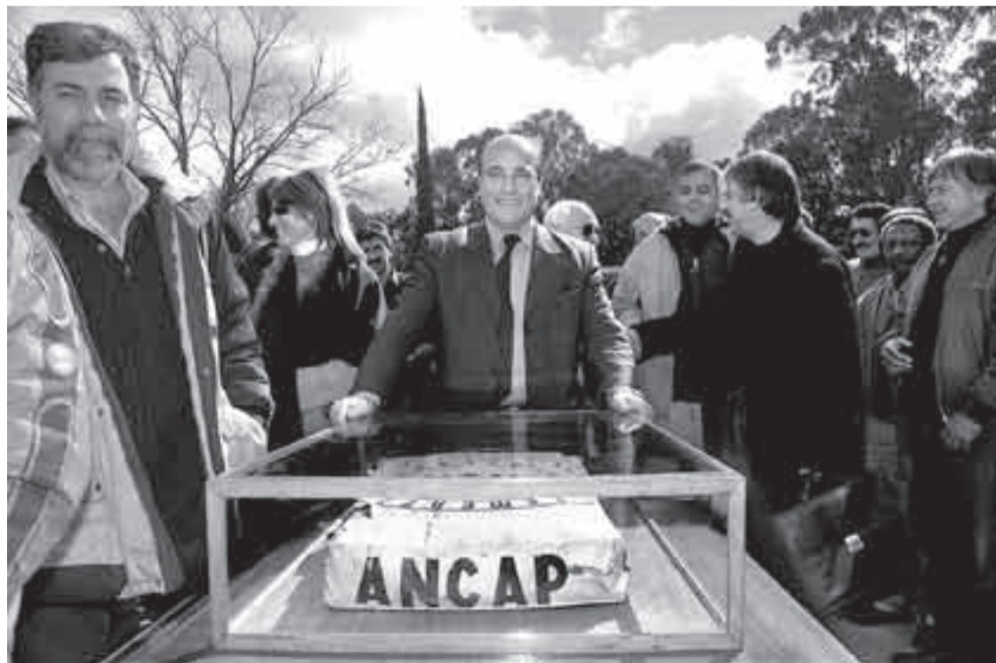
El presidente de ANCAP, Daniel Martínez, frente a la primera bolsa producida por la fábrica, ayer de mañana durante los festejos por el 50 aniversario de la producción de cemento en la Fábrica de Portland de la ciudad de Minas.

La meta más ambiciosa de este gobierno es la “reforma del Estado que consagrará la inversión productiva y más y mejor empleo”, enfatizó ayer el ministro de Economía, Danilo Astori. El jerarca calificó como “inéditos” los niveles alcanzados de inversión privada y pública. Según aseguró, esta última se duplicó en los primeros meses de 2006 y “va a seguir incrementándose” a partir de las propuestas incluidas en la Rendición de Cuentas. Astori destacó el “muy importante” esfuerzo en materia de inversión, que “se traduce” en empleo, y recordó que Uruguay alcanzó la “mayor tasa de empleo” de los últimos veinte años y la menor tasa de desempleo de los últimos diez años. Agregó que el informalismo es un “tema preocupante”, pero aseguró que el gobierno está “absolutamente comprometido y estamos intentando atacarlo por varias vías”. Astori señaló que Uruguay tiene “mucho potencial” para mejorar su inserción internacional fuera del Mercosur. Concluyó: “El país necesita encontrar una respuesta a problemas evidentes dentro de nuestro bloque regional que a esta altura nadie puede discutir, algunos de ellos gravísimos”. ■