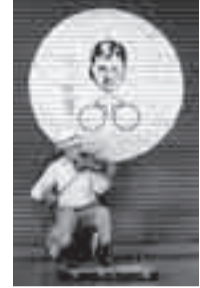
Violinista en la peatonal Sarandí, Montevideo.

Los viernes reservamos este espacio para una fotografía que no trata de un tema del día, aunque sí de actualidad. Cada una de ellas, además, es parte de un grupo. La que publicamos hoy, al igual que las próximas, pertenecen a una serie de músicos callejeros.