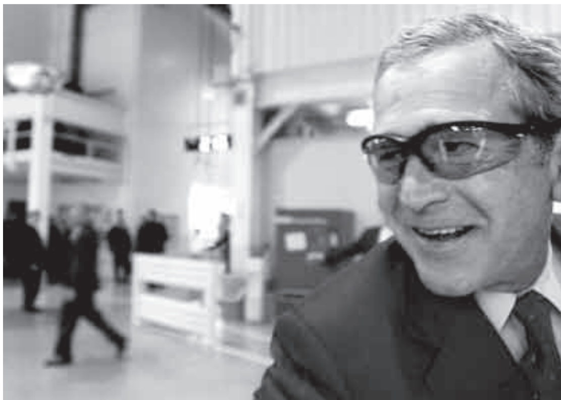
El presidente estadounidense George W. Bush en la planta de ensamblaje de la compañía Harley-Davidson en York, el miércoles 16 de agosto.

▼ UNA JUEZA ORDENÓ DETENER EL PROGRAMA DE ESCUCHAS DE BUSH POR INCONSTITUCIONAL