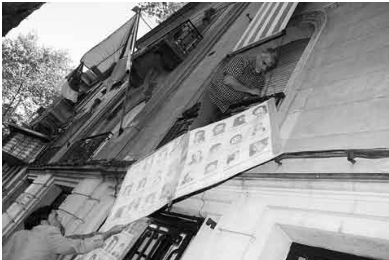
Integrantes de la Mesa Permanente contra la Impunidad frente a la sede del Frente Amplio.

“En estas circunstancias, [pedir perdón] satisfaría moralmente más al ofensor que a la víctima. El Estado debe asumir, reconocer, admitir. Es esto lo que la Corte IDH ordena”.