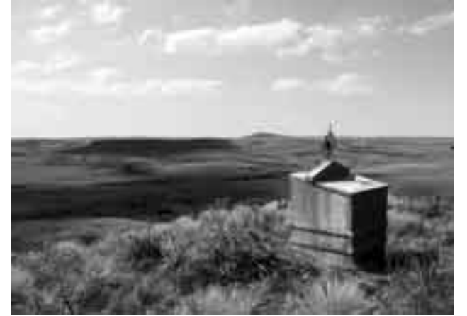
Cementerio de Pepe Núñez.