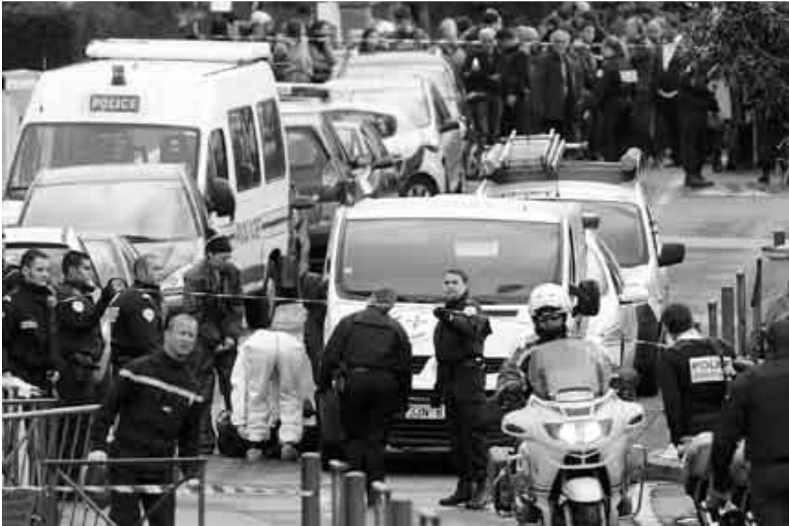
Agentes de la Policía científica en la zona próxima al colegio judío Ozar Hatorah, ayer, en Toulouse, Francia.