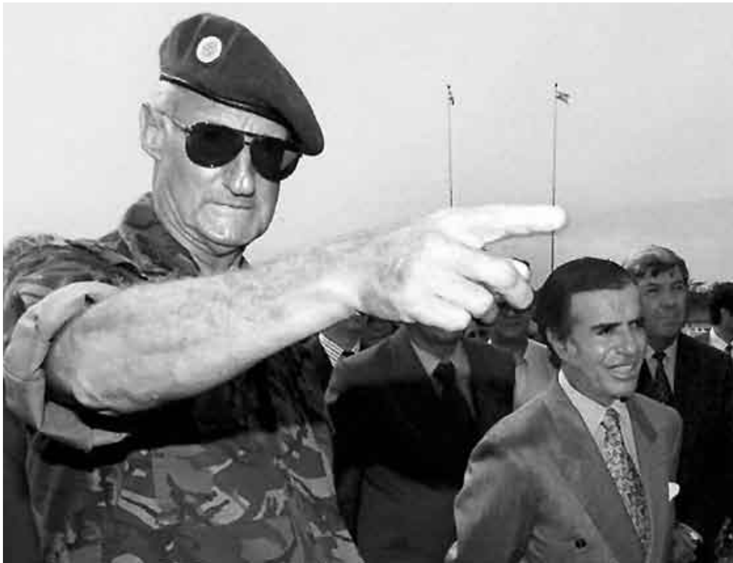
Fotografía fechada en noviembre de 1994 en Buenos Aires, Argentina, del entonces jefe del Ejército argentino, general Martín Balza (izquierda), junto al también entonces presidente Carlos Menem.

una orden de arresto en marzo de 2009 por sospechas de crímenes de lesa humanidad; no obstante, sigue en funciones e incluso viaja a países que adhieren al estatuto de la CPI, a pesar de los reclamos para que sea detenido. A Gran Bretaña no ha ido.