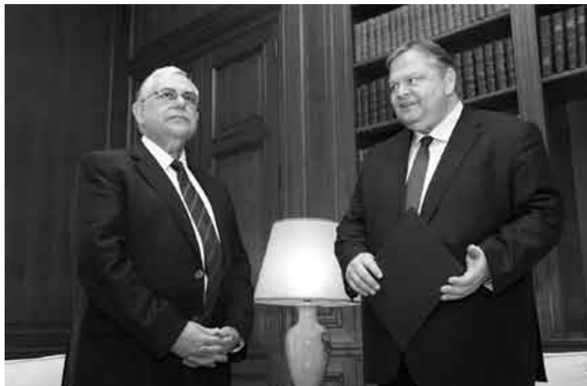
El primer ministro griego, Lukas Papademos (izq.), y el nuevo líder del Movimiento Socialista Panhelénico, Evangelos Venizelos, ayer, durante una reunión en Atenas, Grecia.

Pese al triunfo en la interna de su partido, el panorama electoral para Venizelos es negro: los sondeos atribuyen al Pasok entre 8% y 15% de intención de voto, en unas elecciones