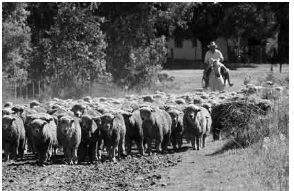
Javier Gutiérrez lleva al campo una majada de ovejas después de ser bañadas.