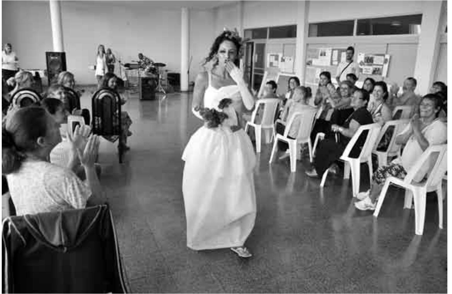
Actividad recreativa en el Centro Nacional de Rehabilitación.

El artículo 26 de la Constitución dice: "A nadie se le aplicará la pena de muerte. En ningún caso se permitirá que las cárceles sirvan para mortificar y sí sólo para asegurar a los procesados y penados, persi-