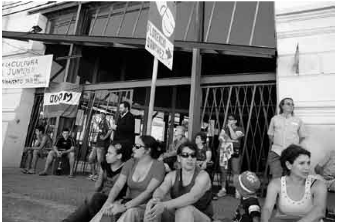
Festival organizado por los funcionarios del Centro Cultural Florencio Sánchez, en la Villa del Cerro, en reclamo de inversiones y equipamiento del lugar.