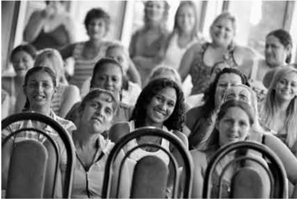
Actividad recreativa en el Centro Nacional de Rehabilitación.