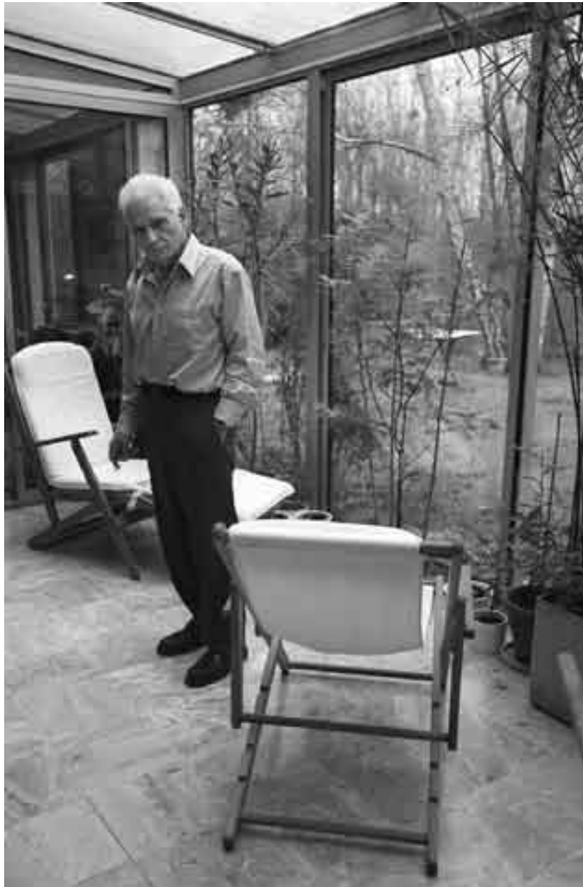
Jacques Derrida fotografiado en su casa en París el 6 de enero de 2001.

El peligro del acto de perdón ritualizado, advierte Derrida, es que se vuelva un simple simulacro.