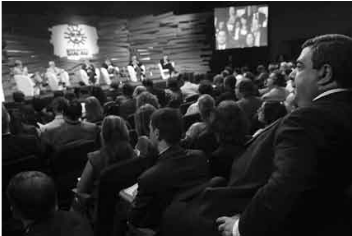
Mario Bergara, presidente del Banco Central, en el panel Navegando las tormentas financieras internacionales durante la asamblea anual de gobernadores del BID

El Banco Interamericano de Desarrollo (BID) divulgó su Informe Macroeconómico de América Latina y el Caribe 2012, en el marco de su 53ª Asamblea Anual de Gobernadores realizada en Montevideo. Titulado "El mundo de los senderos que se bifurcan", analiza las fortalezas y vulnerabilidades de la región ante la crisis de las economías centrales, e incluye recomendaciones para nuevas turbulencias. Pronostica que la economía de la región promediará un crecimiento de 3,6%, pero alerta contra una "recesión relativamente moderada".