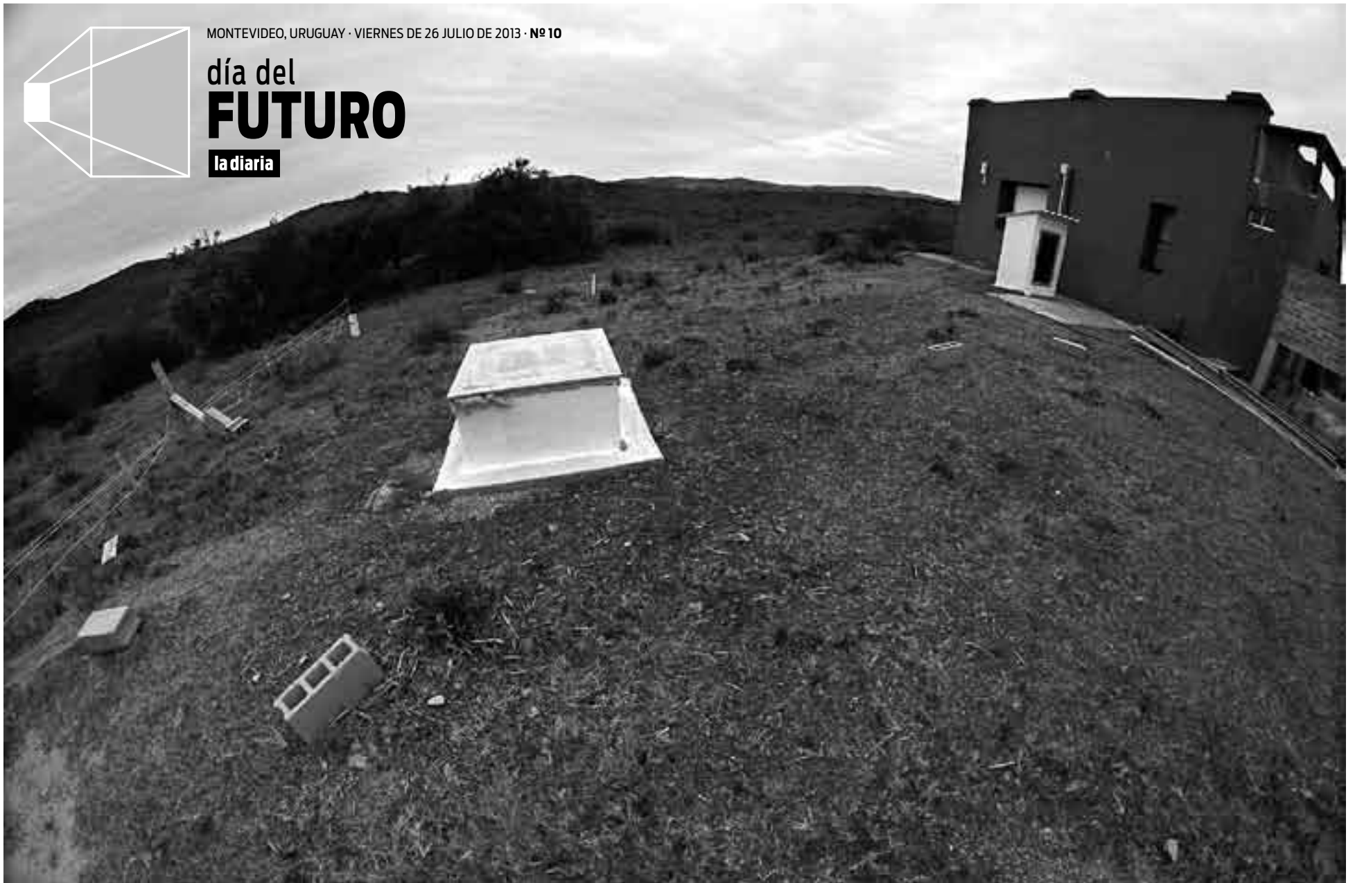
Nicho donde se encuentra el sismógrafo del Observatorio Geofísico de Aiguá, ubicado en la estancia turística Lagunas del Catedral; sus coordenadas son -34^{\circ} 20' 0,89'' S y -54^{\circ} 42' 44,72'' W , h: 270 m.