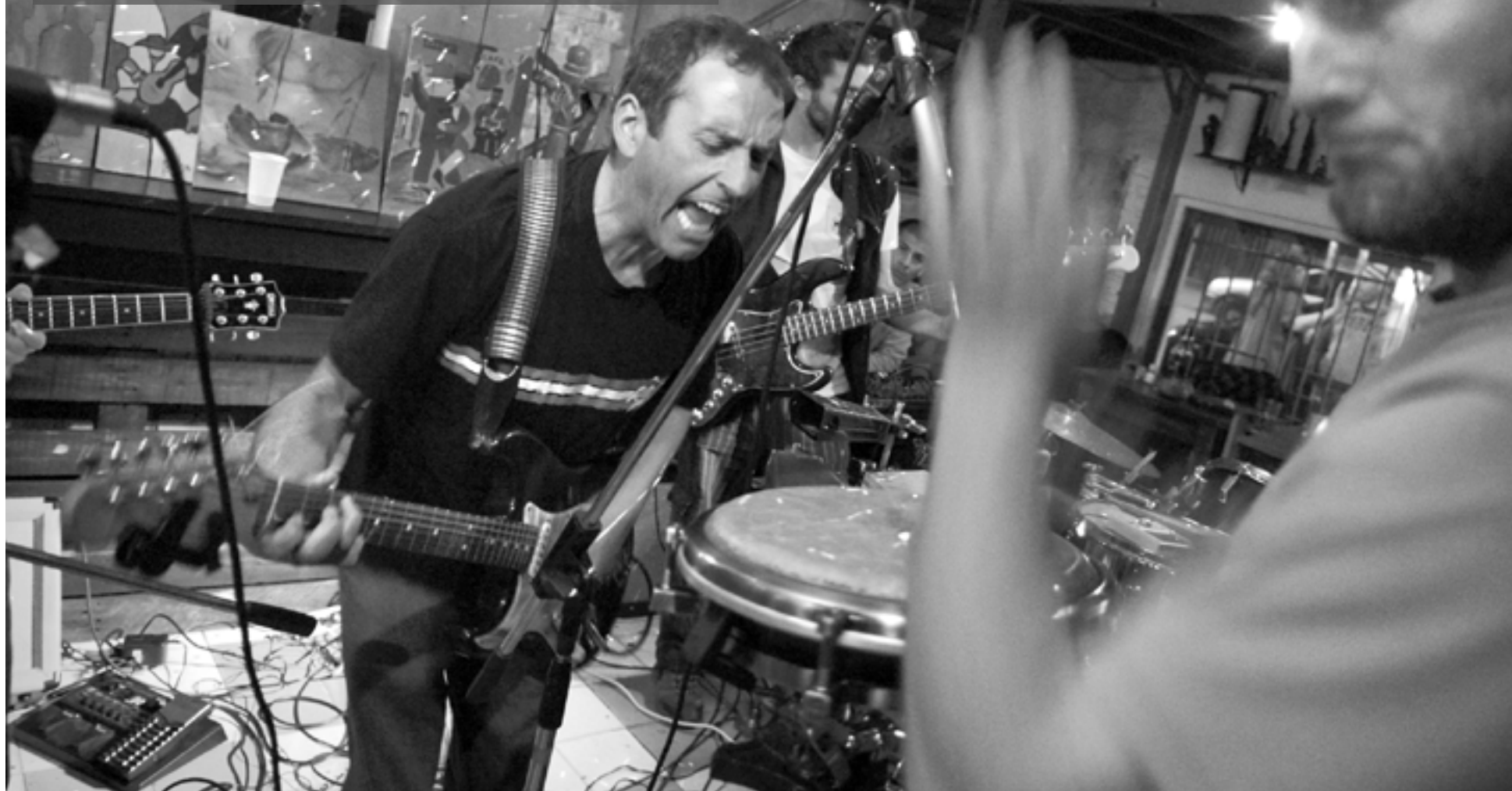
Concierto de la banda Maisterra y los Tsunami Riders, el sábado, en Garuffa's Bar.