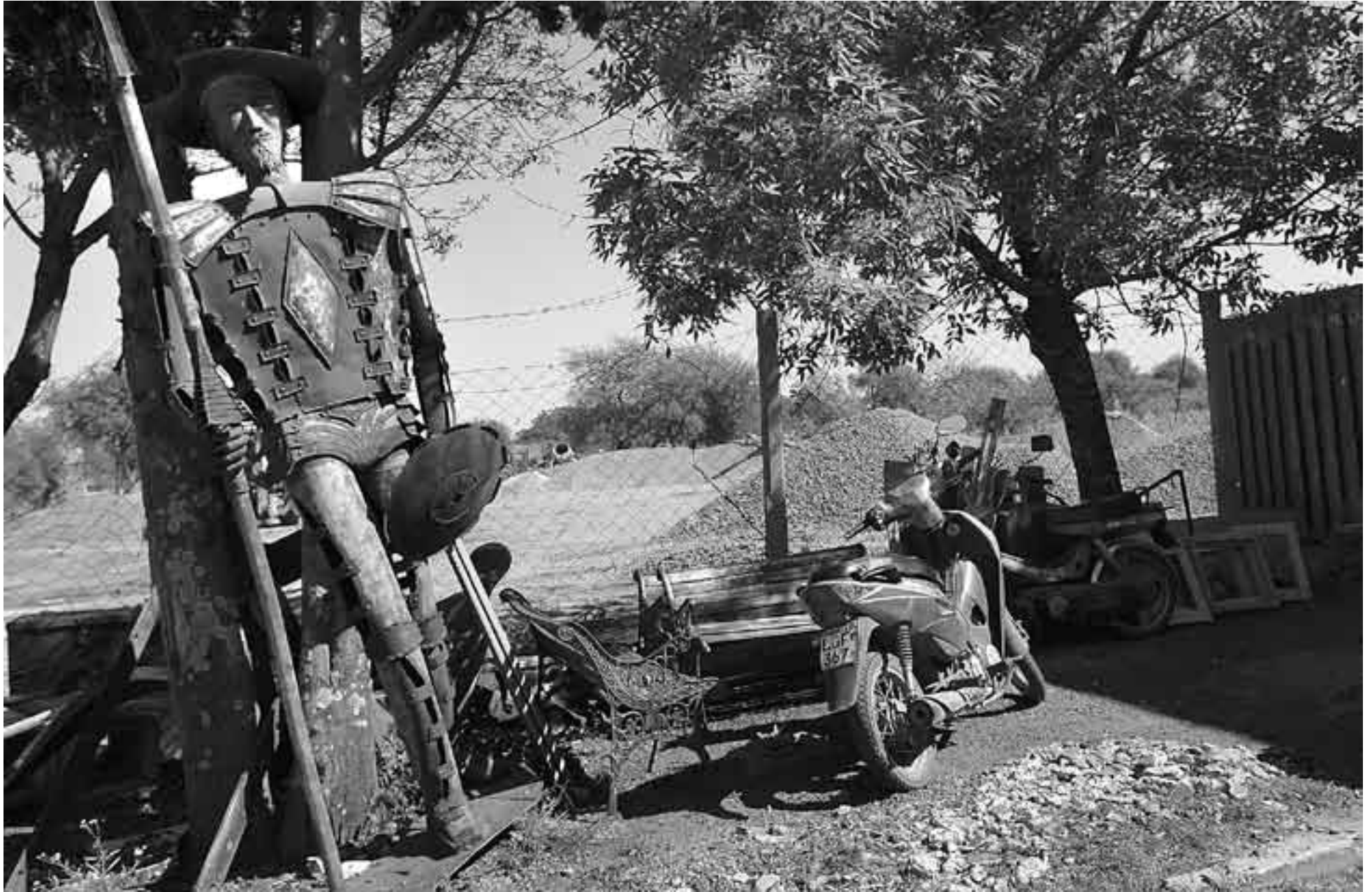
Escultura del Quijote en el corralón municipal de Nueva Palmira.