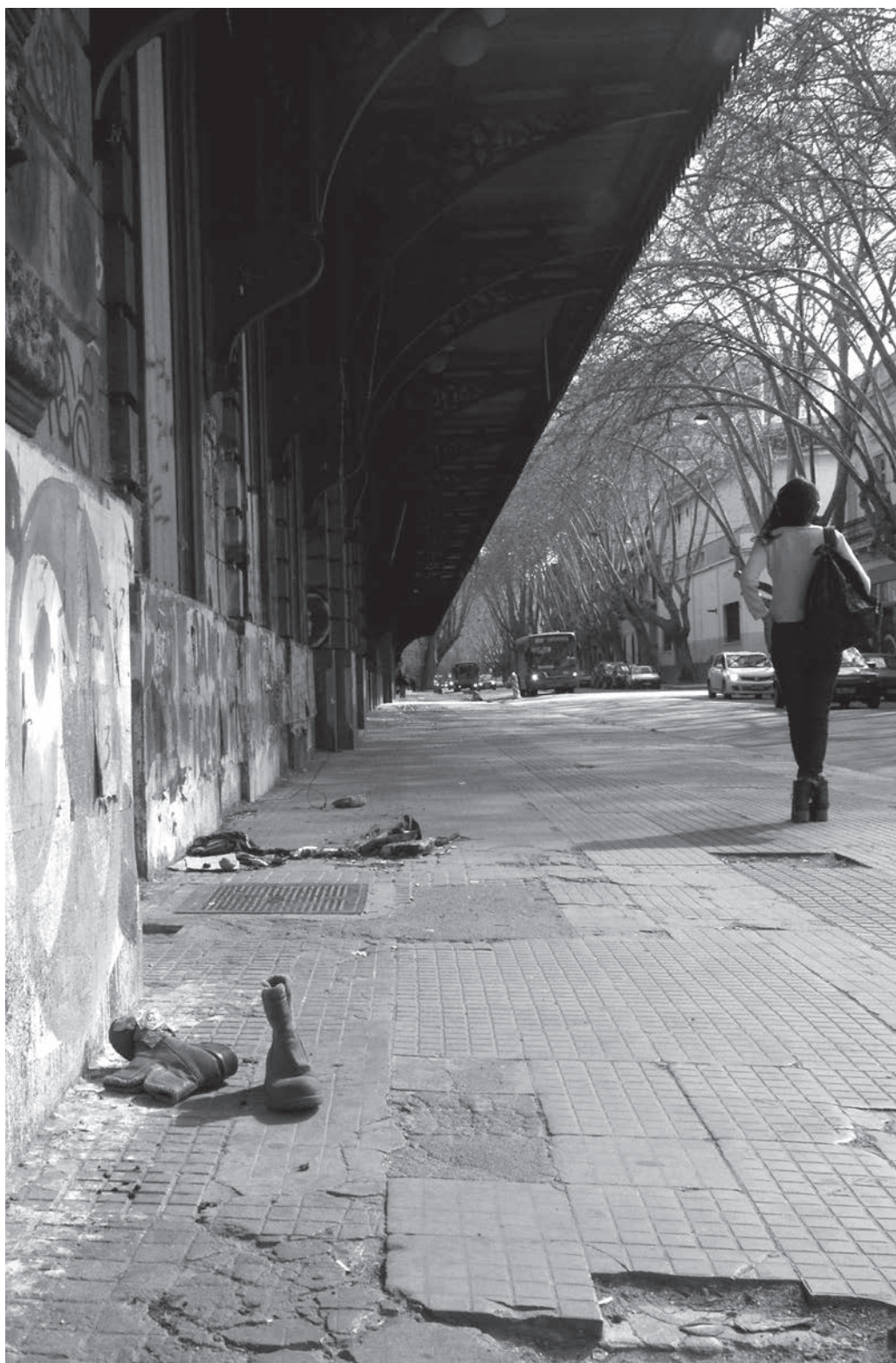
Estación Central de AFE, esquina de Avenida Gral. Rondeau y La Paz, en Montevideo.