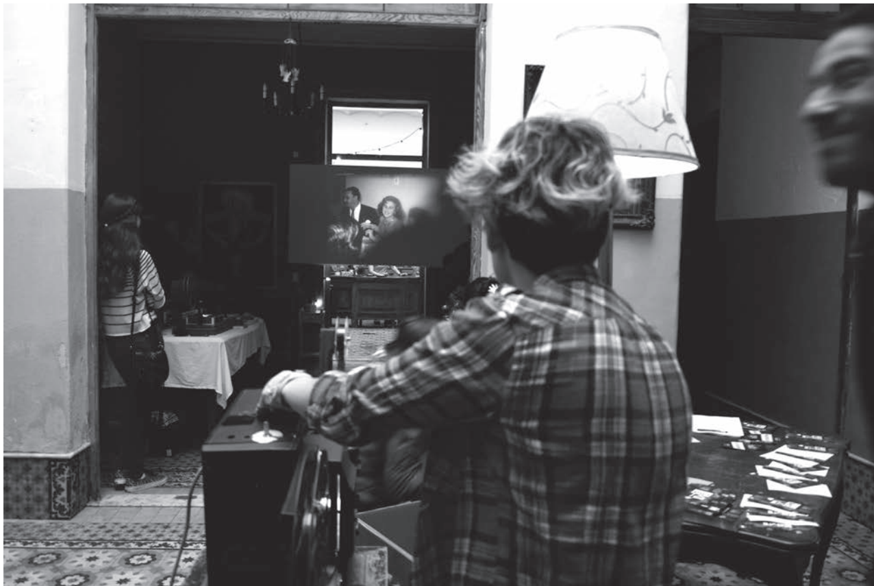
Actividad: Cine Casero en Casa Tatú el domingo 28 de setiembre. / FOTO: ALESSANDRO MARADEI