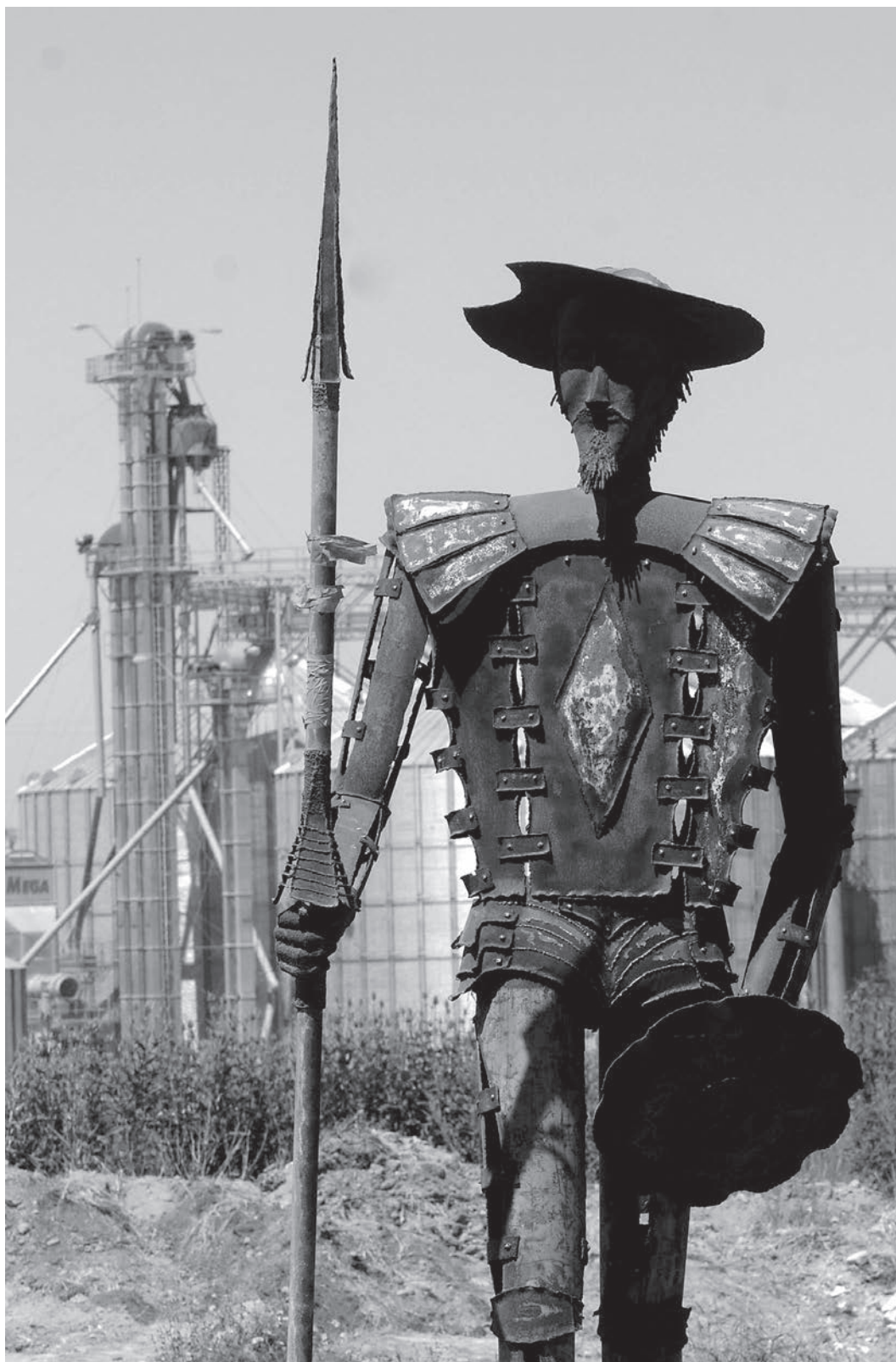
Obra del artista Ruben Mazzola con la idea de Myriam Costa, ubicada en la entrada de la ciudad de Nueva Palmira en el departamento de Colonia.

También se están revisando las modalidades en el dictado de clases, y en su espacio abierto a la comunidad se